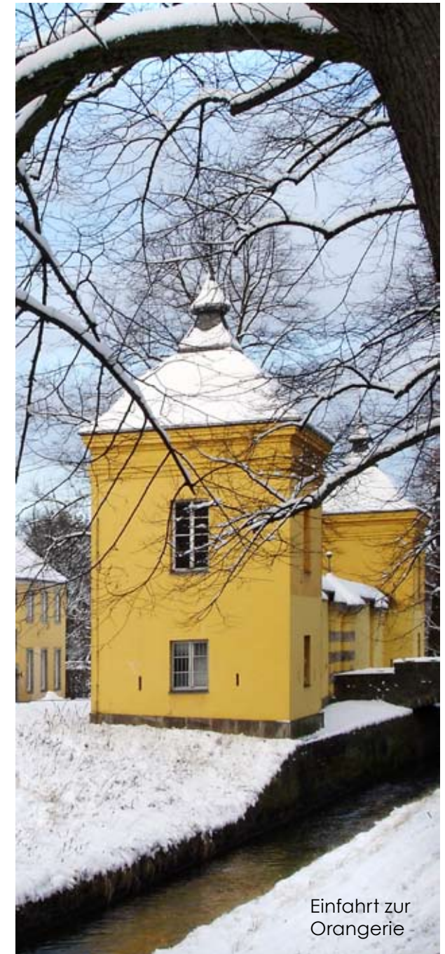
Einfahrt zur Orangerie

Der Altar in der Kapelle und die Fresken, Stukkaturen und Kamine in der Orangerie sind Werke italienischer Künstler gegen Ende des 17. Jahrhunderts während der Regierungszeit des Kurfürsten Johann Wilhelm.