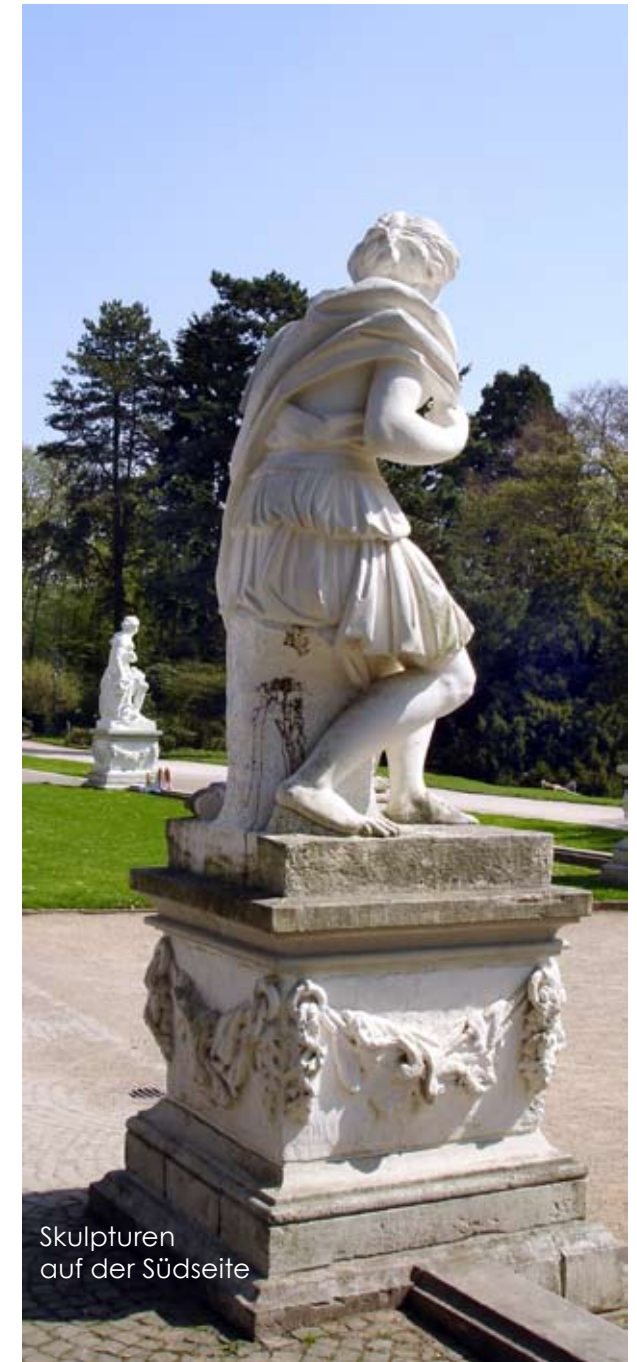
Skulpturen auf der Südseite

Von ebensolcher Bedeutung war Wilhelm Lambert Krahe. Er schuf die Deckengemälde im Kuppelsaal und in den Gartensälen: Aurora und Diana im Kuppelsaal, Jupiter im Götterhimmel im westlichen Gartensaal für den Kurfürsten und Apoll im Kreise der neun Musen im östlichen Gartensaal für die Kurfürstin.