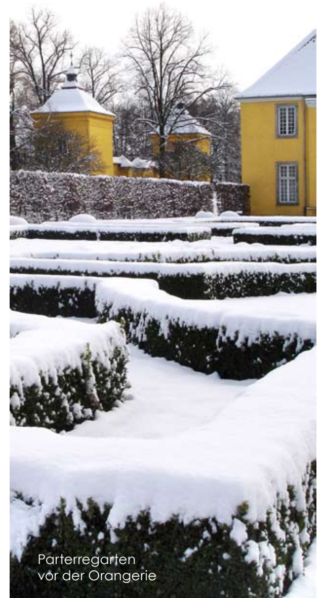
Parterregarten vor der Orangerie

Im Laufe des 15. Jahrhunderts wurde diese Burg zu einer Wasserburg umgebaut. Doch nahm sie im Dreißigjährigen Krieg einen solchen Schaden, dass sie keinen fürstlichen Aufenthalt mehr zuließ, was dann letztlich zu dem Neubau des ab 1660 im Spiegelweiher neu errichteten Schlosses führte.